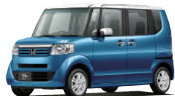
N-BOX アイドリングストップ